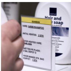
Kortsystemet sikrer, at plejepersonalet aldrig løber tør for varer.

Depotet er lille – ca. 35 m 2 – det er imponerende lille for et plejecenter med 95 beboere. Især når det ikke længere er nødvendigt med depoter på gangene og i boligerne. Et smart kortsystem sikrer, at der altid er tilstrækkeligt med varer.