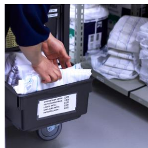
Det er let - og hurtigt - at genopfylde, når alle varer er lige til at snuppe.

Når vagten er slut, tager plejepersonalet LEAN-artikelvognen med retur til 'parkeringspladsen' på vej til omklædningen. På vej ud af elevatoren møder personalet 'supermarkedet' af varer i kælderens. En lille gåtur på fire skridt med vognen forbi hylderne, og LEAN-artikelvognen er genopfyldt og klar til næste kollega, der møder ind.