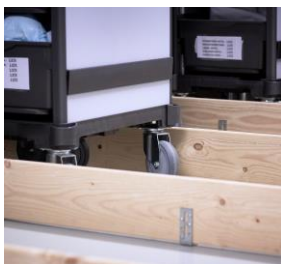
Særligt indrettede båse sikrer, at vognene altid står i orden – klar til brug.

Men først skal de fylde den op, så den er klar til næste dag. Det burde være nemt. For lageret, der findes i samme rum som vognens parkeringsplads, er optimeret. Ting, der ikke blev brugt, er smidt ud. Det er gjort overskueligt, og det er sammenhængende. Alt er afmærket, og hver ting har sin egen plads med tydelige afgrænsninger. Og det er let at holde orden.