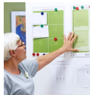
De bæredygtige LEAN-forbedringstavler sikrer, at alle bliver hørt, når de løbende forbedringer foreslås og implementeres.

LEAN er en kontinuerlig proces, der hele tiden skal vedligeholdes. Det gøres bl.a. med ugentlige tavlemøder.